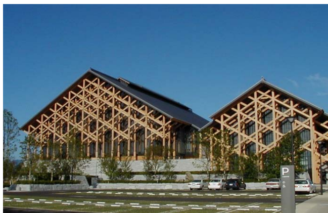
日本武道館に並ぶ日本最大級の規模